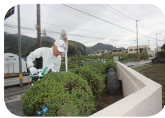
コミュニティセンターの施設周辺の環境整備作業（木の剪定や除草作業）