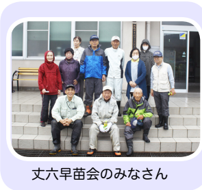
丈六早苗会のみなさん